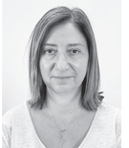
Της Δέσποινας Ησσία

• 9η ΦΕΒΡΟΥΑΡΙΟΥ: Με τη θέσπιση της Παγκόσμιας Ημέρας της Ελληνικής Γλώσσας επιδιώκεται η ανάδειξη του θεμελιώδους ρόλου που διαδραμάτισε η ελληνική γλώσσα ανά τους αιώνες, συμβάλλοντας ουσιαστικά στην εδραίωση τόσο του ευρωπαϊκού όσο και του παγκόσμιου πολιτισμού. Η γλώσσα είναι η έκφρασή μας, η πραγματικότητα μας, είναι η ιστορία μας, η ζωή μας, είναι η νοοτροπία και η ταυτότητά μας. Αγαπάμε την ελληνική γλώσσα.