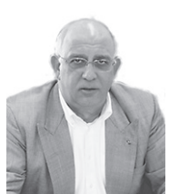
Του Χρίστου Καρούδη

Ένα βράδυ σχολώνοντας από τη βάρδια στην εφημερίδα «Αλήθεια», γύρω στις 10μ.μ., συνάντησα τρεις κορυφαίους ανθρώπους της δημόσιας ζωής έξω από τα κεντρικά γραφεία του ΔΗΣΥ. Τους πλησίασα, τους καλησπέρισα και αρχίσαμε την κουβέντα. Ήταν ο τότε υπουργός Εργασίας Ανδρέας Μουσιούττας, ο ηγέτης της ΣΕΚ Μιχαλάκης Ιωάννου και ο Ανδρέας Ζαρτιδής, ο οποίος υπήρξε συμμαθητής στο Παγκύπριο Γυμνάσιο με τον Γλαύκο Κληρίδη, Πρόεδρο τότε της Δημοκρατίας. Είχαν συνάντηση με τον Πρόεδρο μακριά από τα φώτα της δημοσιότητας.