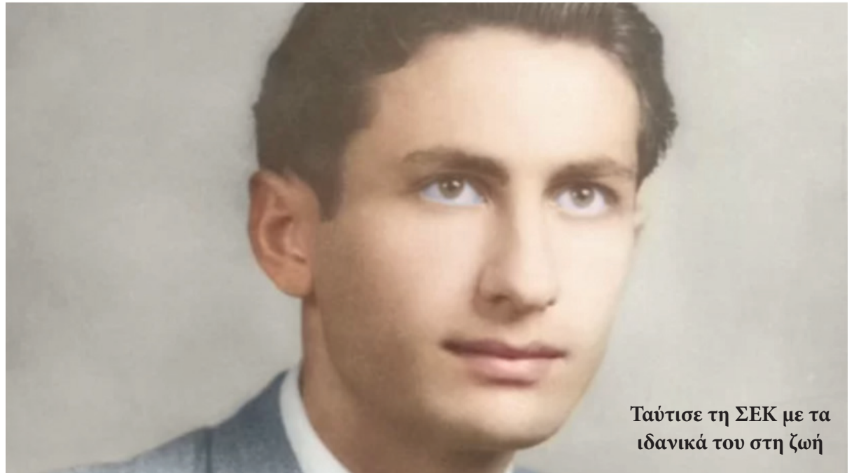
Ταύτισε τη ΣΕΚ με τα ιδανικά του στη ζωή

Καλλιτεχνική επιμέλεια εκδήλωσης / Ενορχηστρώσεις / Σύνθεση πρωτότυπων τραγουδιών: Κυριάκος Κώστα