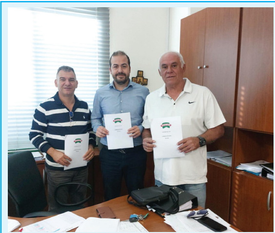
Ανανεώθηκε η Συλλογική Σύμβαση των εργαζομένων της εταιρείας «ΓΡΗΓΟΡΙΟΥ Β.Ε. ΑΤΔ»

Υπεγράφη η ανανέωση της Συλλογικής Σύμβασης των εργαζομένων της εταιρείας «ΓΡΗΓΟΡΙΟΥ Β.Ε. ΑΤΔ», καλύπτοντας την περίοδο από 1 Μαρτίου 2024 έως 28 Φεβρουαρίου 2027.